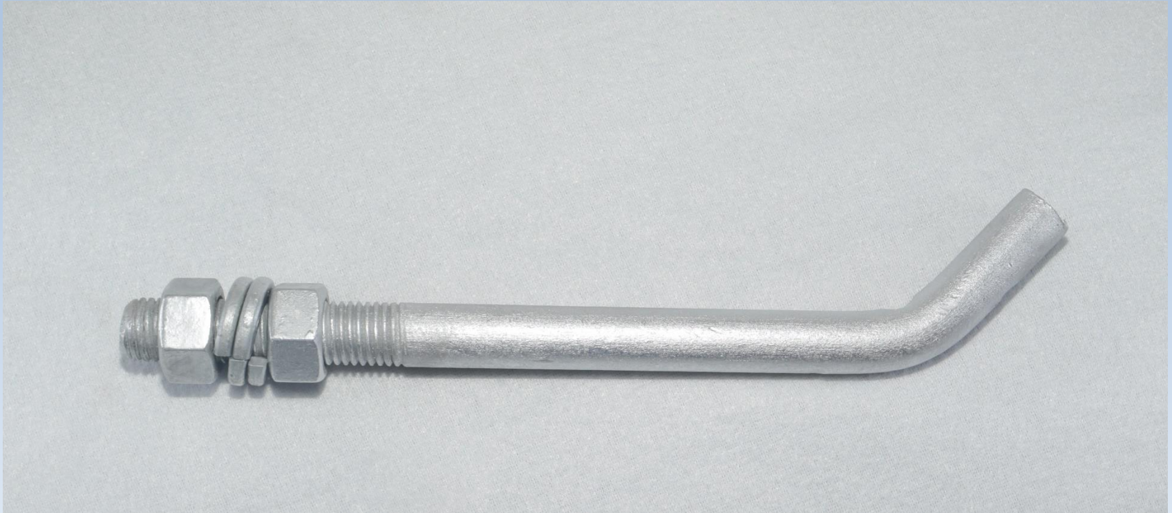
Step Bolt o escalón para ascenso a torre de telecomunicaciones de 5/8" x 20 cms $ 100 más IVA la pieza